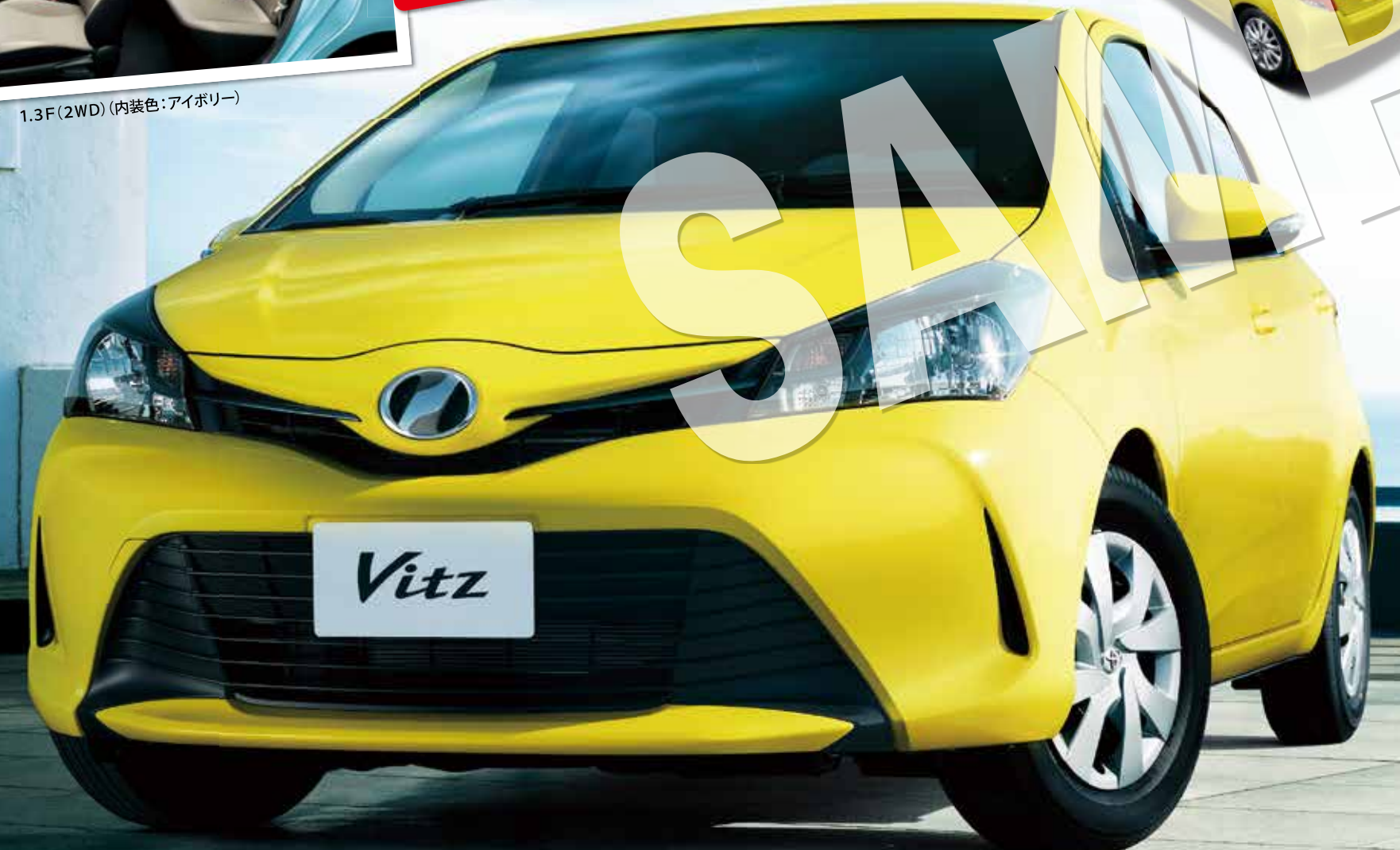
1.3F (2WD) ルミナスイエロー