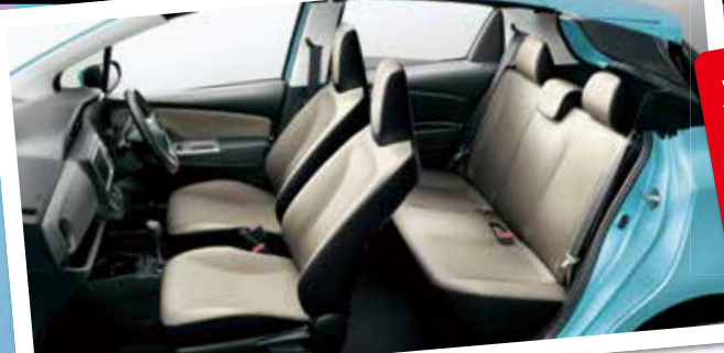
1.3F (2WD) (内装色: アイボリー)