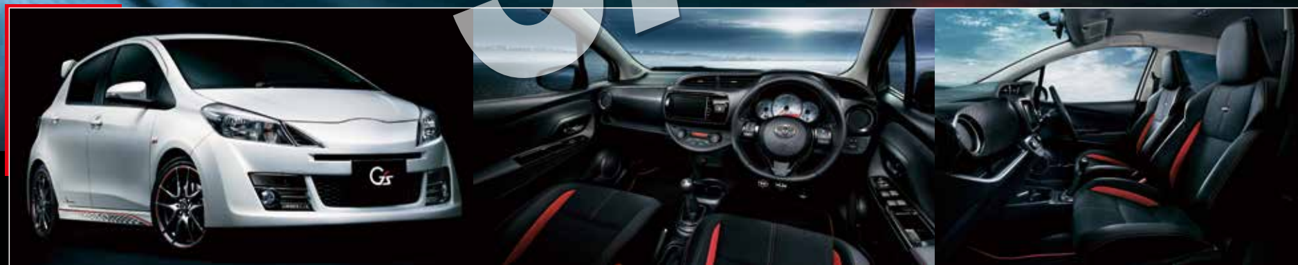
Vitz 1.5RS*G's (MT) (内装色:ブラック)