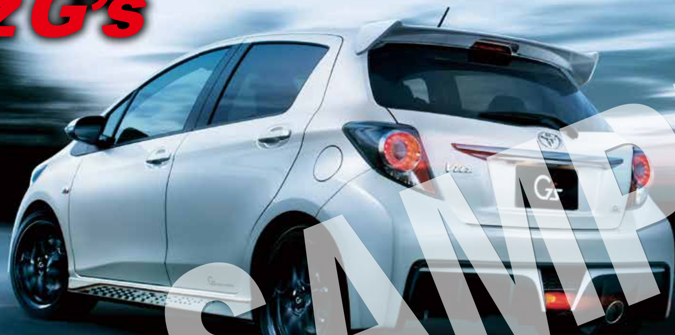
Vitz 1.5RS*G's (MT) (ホワイトパールクリスタルシャイン)