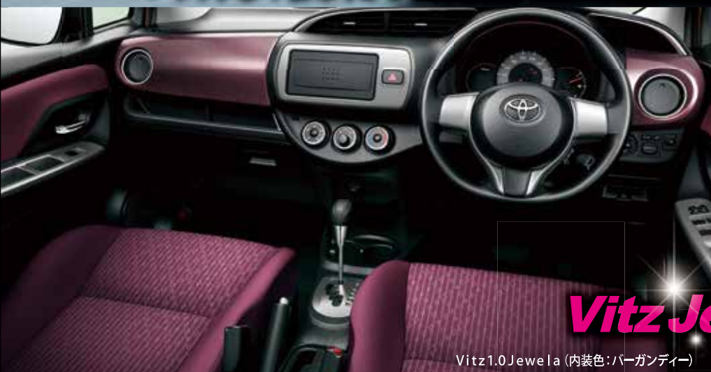
Vitz 1.0Jewela (内装色:バーガンディ)

ベーシックな「F」、華やかさを表現した「Jewela」、上質感を追求した「U」、スポーティな「RS」と4つのグレードを用意。