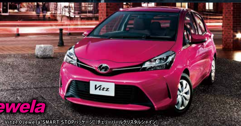
Vitz 1.0Jewela*SMART STOPパッケージ (チェリーパールクリスタルシャイン)