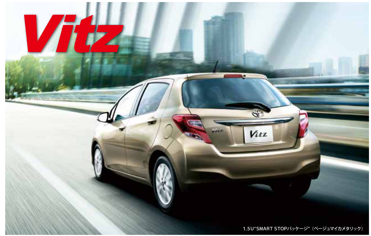
1.5U *SMART STOPパッケージ (ベージュマイカメタリック)