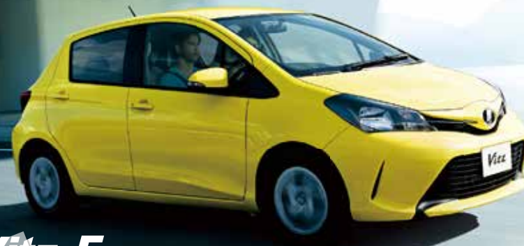
Vitz F ベーシックタイプ Vitz 1.3F (2WD) ルミナスイエロー