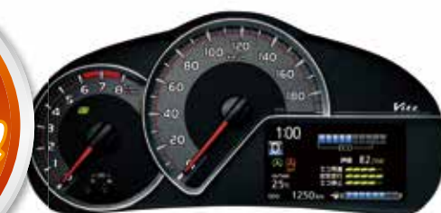
スピードメーター (1.3ℓ (2WD) 車、*SMART STOPパッケージに標準装備)