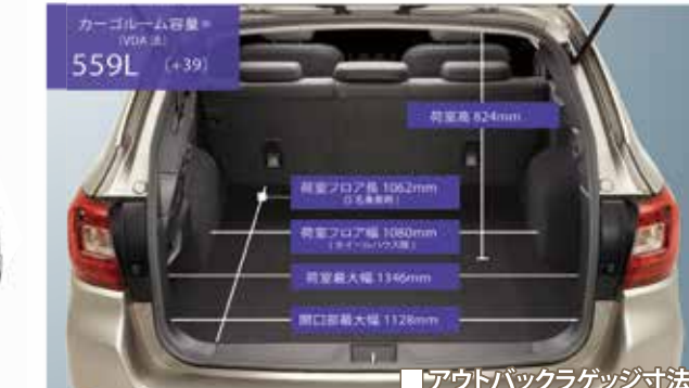
■アウトバックラゲッジ寸法