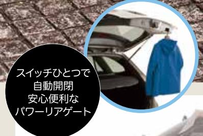
スイッチひとつで自動開閉 安心便利なパワーリアゲート