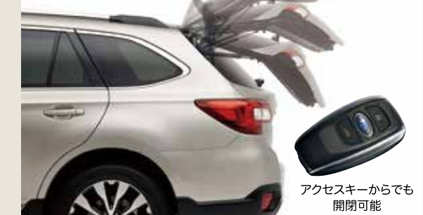
アクセスキーからでも開閉可能