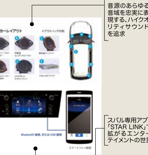
音源のあらゆる音域を忠実に表現する、ハイクオリティサウンドを追求