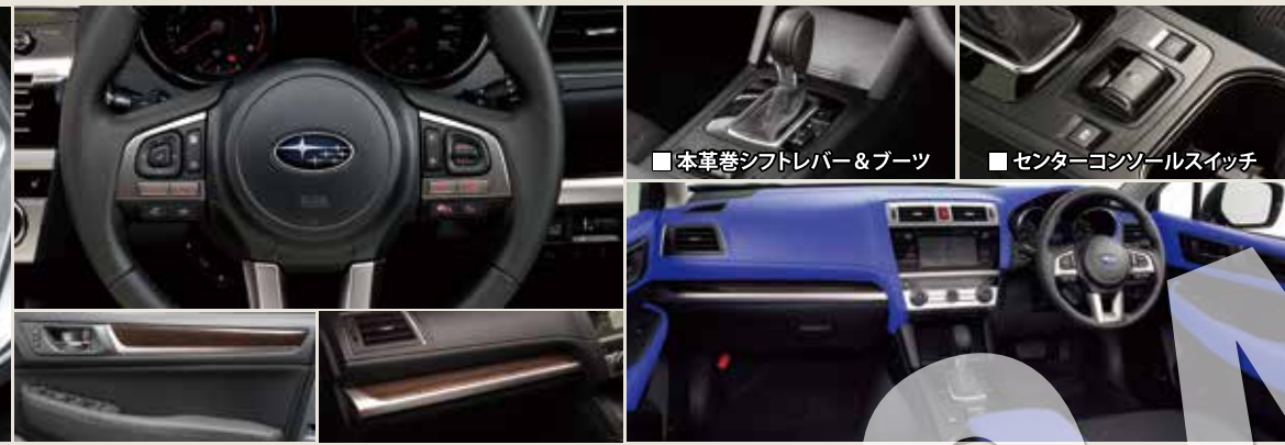
■ステアリングスイッチ