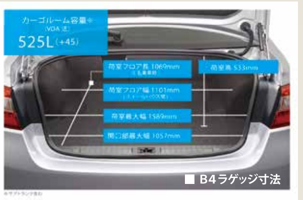
カーゴルーム容量* (VDA法)