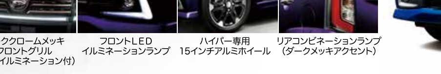
ダーククロームメッキフロントグリル (LEDイルミネーション付)