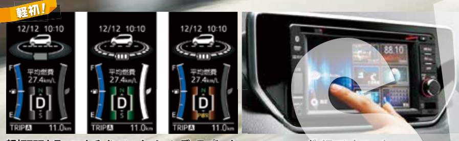
軽初TFTカラーマルチインフォメーションディスプレイ（エコアシストドライブ照明）

使い勝手を向上させる機能として、新型ムーヴは数々の先進装備を採用した。軽自動車では初採用となるのは、ムーヴカスタムの全車に標準装着されるTFTカラーマルチインフォメーションディスプレイだ。スピードメーターとタコメーターの中央に装着された縦長のディスプレイで、平均燃費、ドアが開いている時の警告、さらにタイヤの向きなどを表示する。この画面がカラーになり、視認性を高めた。表示の切り替えはハンドルのスイッチで簡単に行える。カーナビはボイスコントロールタイプをメーカーオプションとして設定。スマートフォンのように、感覚的に操作できる。音声対話機能も採用したから、使い勝手がさらに高まった。このほかターンランプ（方向指示機）は電子式に変更。スイッチを軽く触れるだけで3回点滅するから、車線を少し変える時などに使いやすい。スーパーUV&IRカットガラス、スーパーグリーンエアフィルターといった快適性を高める装備も豊富だ。運転席のシートヒーターや後席のヒーターなどをセットにしたウォームハックなどが用意され、寒冷地のユーザーにも優しい。