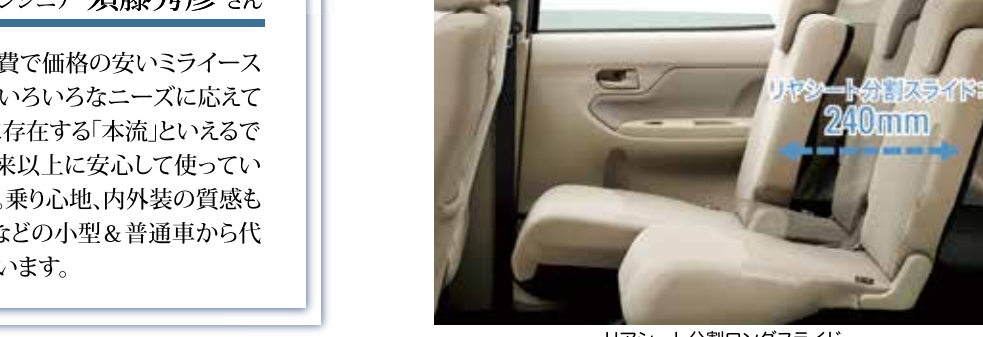
リヤシート分割ロングスライド