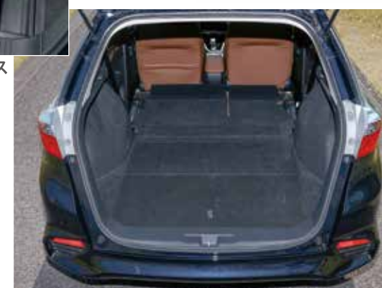
クラス最大のラゲッジスペース