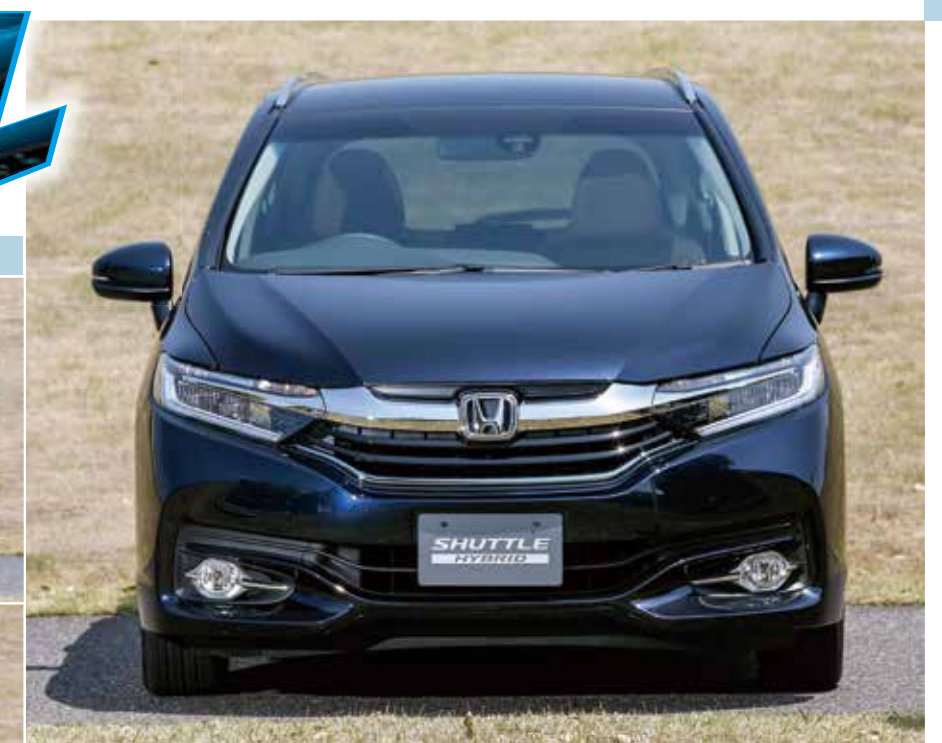
先進性を表現するライトデザイン