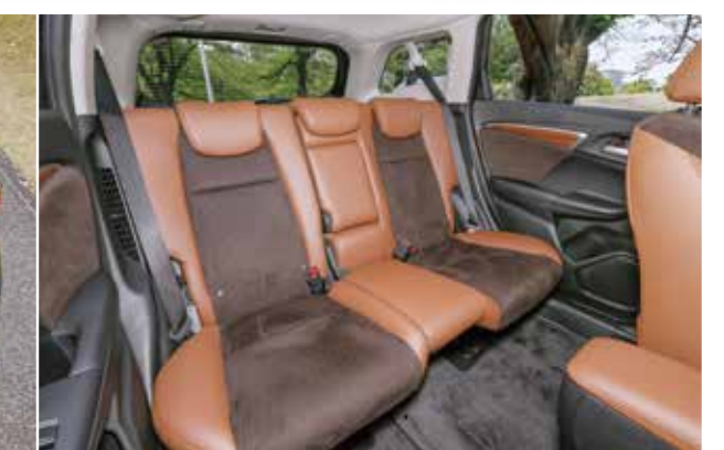
ファブリック/プライムスムーズ コンビシート