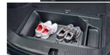
ラゲッジルーム アンダーボックス