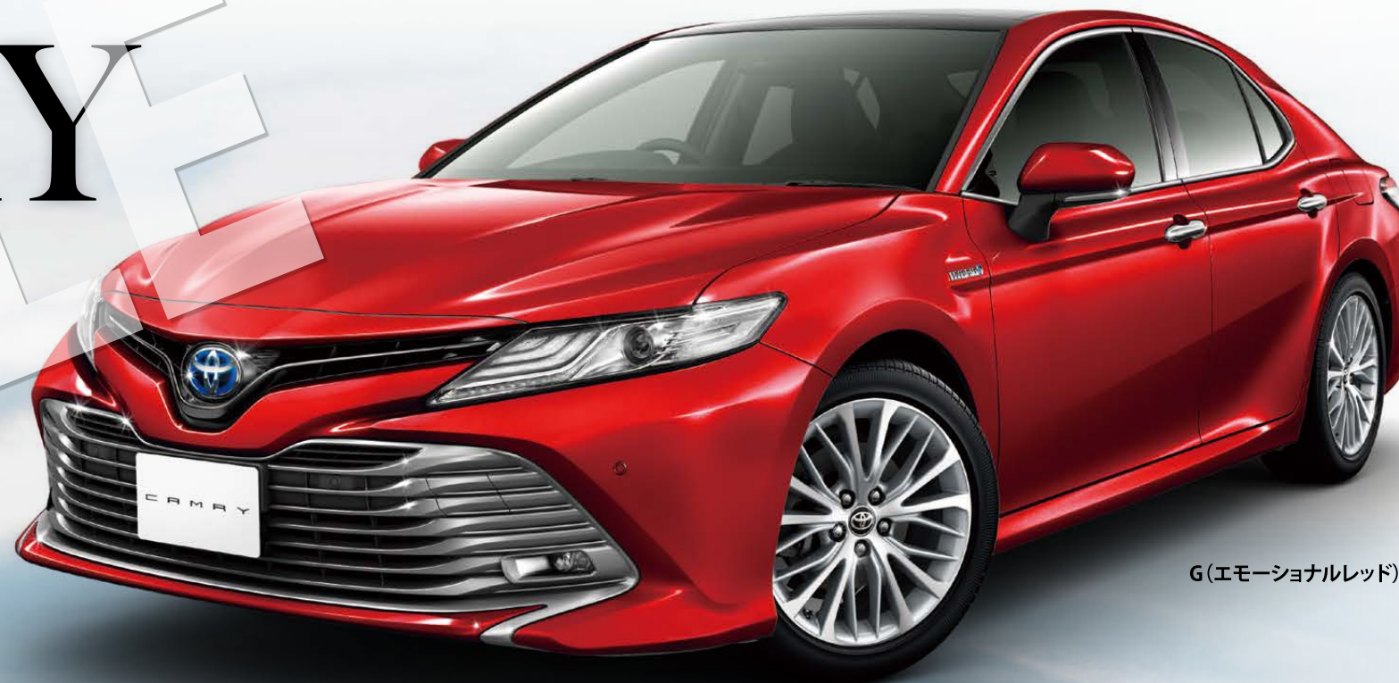
G(エモーショナルレッド)