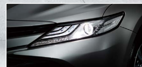
G*レーザーパッケージ (シルバーメタリック)