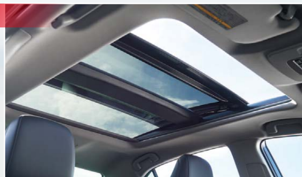
パノラマーフ(チルト&スライド電動)

粋でスタイリッシュなセダンへ進化した新型カムリ。低重心のシルエットはTNGA(トヨタ・ニュー・グローバル・アーキテクチャ)に基づき、エンジンの搭載場所や乗員の着座位置を見直したことで実現したもの。全長4885mm、全幅1840mm、ホイールベース2825mmの伸びやかなサイズと相まって美しいシルエットを形づくっている。フロント回りはスリムなアッパーグリルと大胆なロアグリルが存在感を示し、シャープな造形のLEDヘッドランプが全体を引き締める。ボディサイドは低いベルトラインがタイヤの存在感を強調し、グラマラスなボディの造形がクオリティの高さを物語る。ショートデッキスタイルのリアはクーペのような流麗なラインと、キレのあるデザインのリアコンビネーションランプが過ぎ去る姿を印象づける。走りを感じさせるスポーティなデザインが魅力的だ。