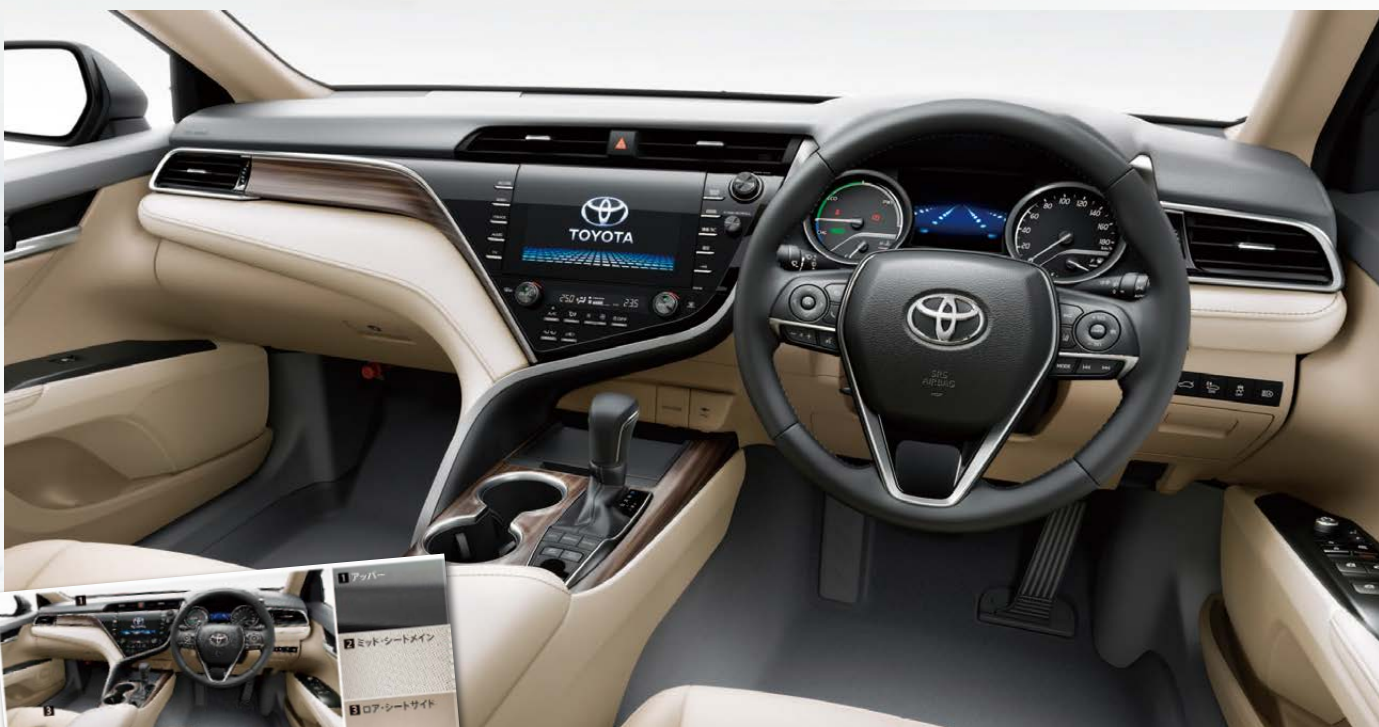
G「レザーパッケージ」(内装色:ベージュ(設定色)(オプション装着車))