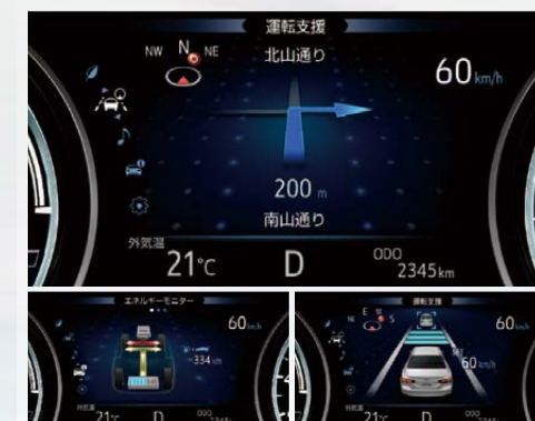
マルチインフォメーションディスプレイ