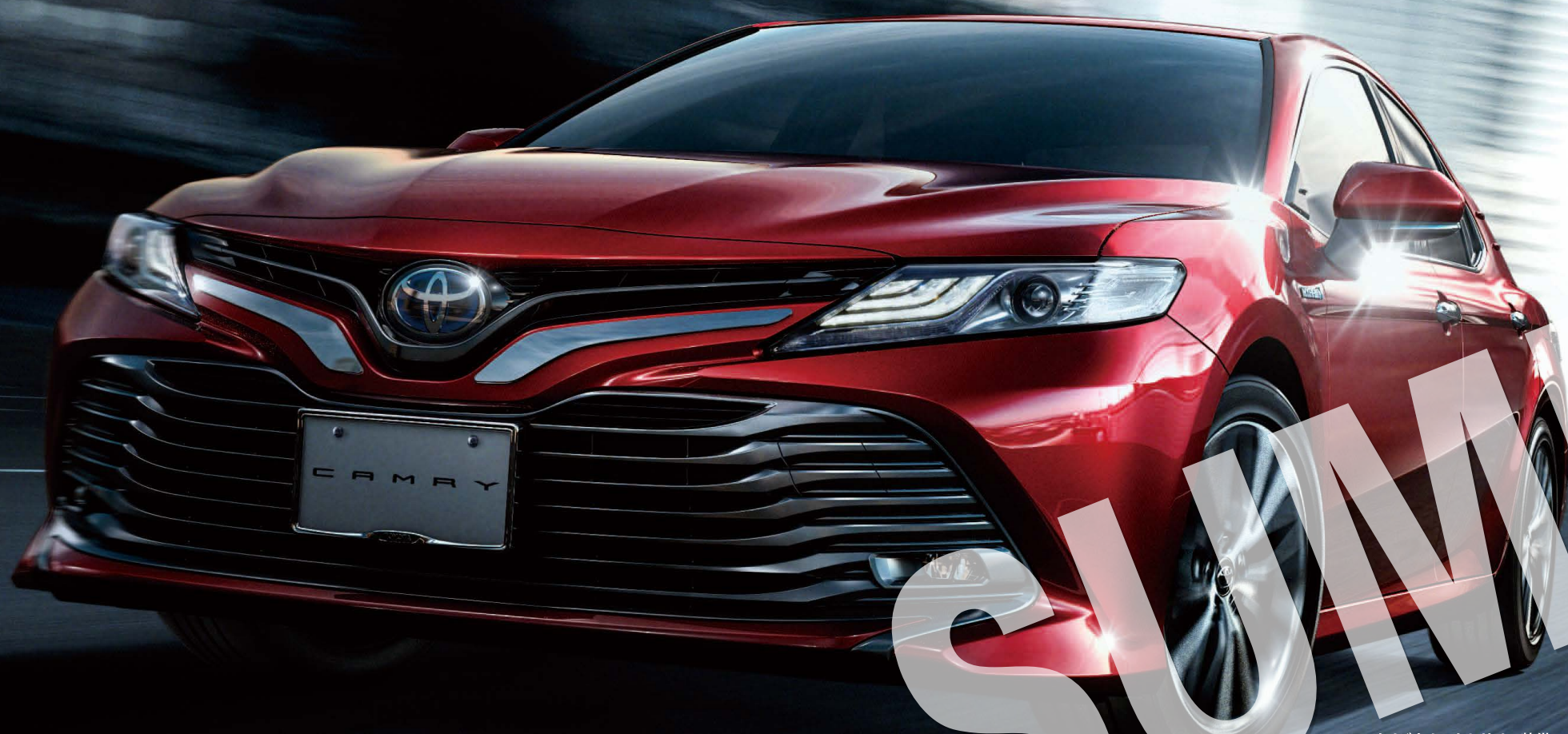
オリジナルアクセサリ装備