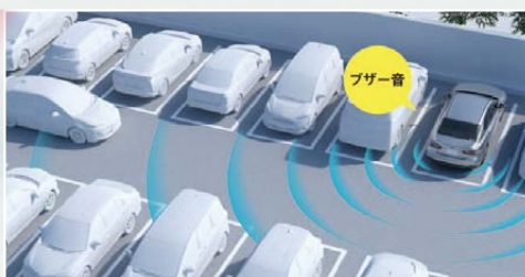
リアクロストラフィックアラート(RCTA)

単眼カメラとミリ波レーダーを組み合わせ、最新の予防安全機能を持つトヨタ・セーフティセンスPを全グレードに標準装備。歩行者検知機能を持つプリクラッシュセーフティ機能に加え、車線からのハミ出し防止を支援するレーンディパーチャーアラート(ステアリング制御機能付き)、ヘッドランプの上下光を自動で切り換えるオートマチックハイビームも装備。レーダークルーズコントロールは全車速対応で追従機能も持ち、ロングドライブ時の疲労を軽減してくれる。また、駐車場などで後退するとき、左右後方から近づいてくるクルマを知らせるリアクロストラフィックアラートも設定され、全方向の安全性を確保。エアバッグはサイド&カーテンエアバッグに加えて運転席ニーエアバッグも備え、万一の衝突時も乗員を守ってくれる。