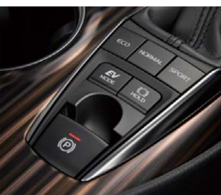
EVドライブモードスイッチ

インテリアの仕立てのよさも新型カムリの大きな魅力だ。ダッシュボードからセンターコンソールにかけての大胆な造形や、継ぎ目のない金属調の加飾に加え、素材や色を丹念にコーディネートした「フレックスコーディネーション」が優れたデザイン性の高さを演出している。宝石のタイガーアイをイメージしたパネル、あるいは寄木調のパネルがセンターコンソールやインストルメントパネルに配置され、シックな上質感を演出。落ち着いた雰囲気を出している。各所に配されたサテンメッキ調加飾やピアノブラック加飾によるアクセントも効いている。後席シートバックは6対4分割可倒が可能で、ラゲッジルームを多用途に活用できるのも嬉しい。