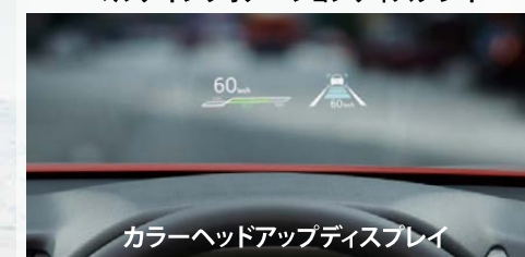
カラーヘッドアップディスプレイ