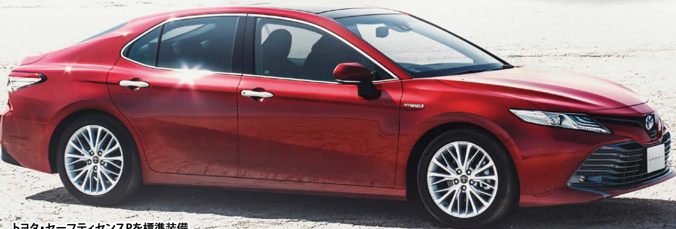
トヨタ・セーフティセンスPを標準装備