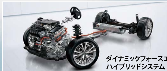
ダイナミックフォースエンジン2.5Lハイブリッドシステム

トヨタ自動車グループがグローバルに取り組むクルマづくりの構造改革。プラットフォームやボディなどを一新し、全体の最適化を考えた開発により、クルマの基本性能や商品力を飛躍的に向上させることを目指す。